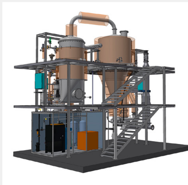
Modell des Holzkohlekraftwerks

Die fossilen Brennstoffe Öl und Gas sind nicht erneuerbar und setzen bei der Verbrennung jede Menge Kohlendioxid frei. Gleiches gilt für Kohlekraftwerke: Um eine negative Emissionsbilanz zu erhalten, muss das Kohlendioxid in den Boden gepumpt werden. Dies kostet nicht nur zusätzliche Energie, sondern hat auch keinen Zusatznutzen, zudem ist das Vorgehen unsicher. Holz als nachwachsender Rohstoff ist daher eine gute Alternative. Auch im Holz befindet sich CO 2 aus der Luft, dieses bleibt