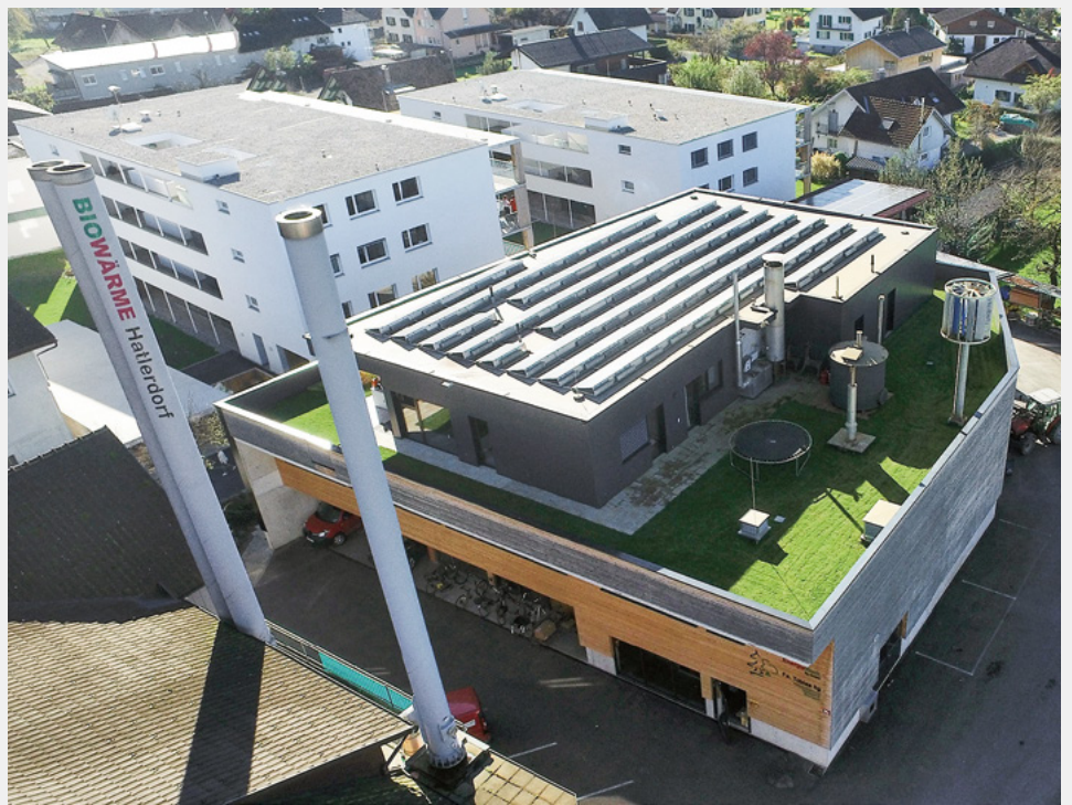
Energiehof Ilg in Dornbirn, Österreich

Je nach regionaler Anforderung wird ein individuelles Wärmenutzungskonzept für jeden Standort entwickelt. Auf Kundenwunsch wird auch ein Trocknungskonzept erarbeitet. Somit wird gewährleistet, dass jedes Holzkraftwerk mit dem regional anfallenden Brennstoff hocheffizient arbeitet und der höchstmögliche Nutzungsgrad erzielt wird. Planung, Bau und Montage erfolgen unter Aufsicht der Tiroler Techniker. Auch bei Inbetriebnahme und zur Optimierung der Leistung wird dem Kraftwerksbetreiber zur Seite gestanden. Dank modernster Technik laufen die Holzkraftwerke vollautomatisch.